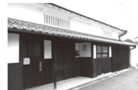
⑤松下家 江戸期の農家

平野は大阪の中でも、最も早く開けた町で、戦国時代には環濠と土居で自衛し、町民が町を運営する自治都市として、堺と共に、近世史に、その足跡を残しています。その商人の富は、大阪の町づくりに力を貸し、江戸時代大和川つけ替えによって、隆盛した河内木綿の集散地として繁栄しました。また商業の発展は、文化の交流を呼び、連歌や、茶道、能楽などを町民に普及させ、連歌所や民間の学問所、含翠堂の創立をみました。戦火に遇わなかった町は、江戸時代そのままに、新旧の町並み、多数の社寺や地蔵堂などの文化財に恵まれ、京都大学の故 西山卯三先生は、町そのものが、博物館だと話されています。