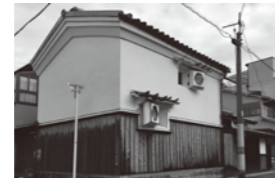
④粕谷家 8月第4日曜、開館 江戸期の商家(元質商)