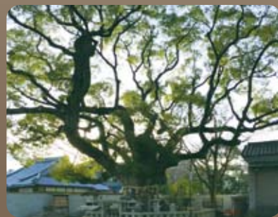
杭全神社 参道脇の大楠

1150年以前に創建された 杭全神社神宮寺跡にある 全興寺境外墓地で 個人永代墓を募集いたします